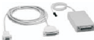
Abbildung: Zentraleninterface Sachnr. 769828 (Esser-Produkt)

Die Programmierung erfolgt weiterhin mit der Software FatProgWin ab Version 3.0 oder höher (Lieferbestandteil/ Download im Internet).